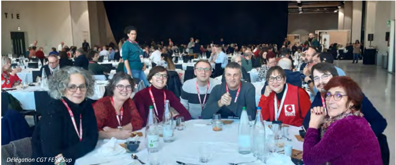
Délégation CGT FERC Sup