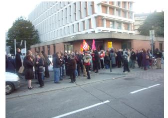
Cité Administrative, 21 oct.