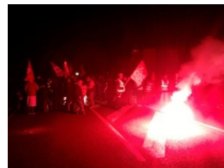
Eurocentre, 27 oct.