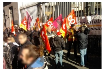
Banque de France, 26 oct.