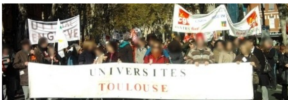
manifestation toulousaine, 28 Oct.