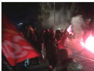
Aéroport, 4 nov.

De 5h à 8h du matin, les accès à l'aéroport de Toulouse Blagnac sont bloqués par 500 manifestants. Parmi eux, l'UTM est représentée par des étudiants et par le syndicat CGT de l'établissement.