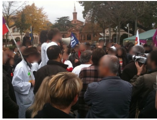
Hôpital Marchant, 5 nov.

En solidarité avec les grévistes de l'Hôpital Marchant de Toulouse qui occupent leur lieu de travail, avec piquets de grève, et menacés par leur direction d'être délogés par la police, l'UTM (étudiants et personnels) se joint aux salariés de nombreux secteurs d'activité pour empêcher l'intervention des CRS qui, devant la mobilisation de presque 500 personnes, n'aura finalement pas lieu.