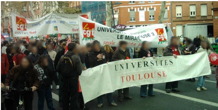
La manifestation toulousaine, 6 nov.

110.000 manifestants à Toulouse et 1,2 millions en France : la lutte contre la réforme des retraites n'est pas morte, contrairement à ce que scandent le gouvernement et les médias depuis une semaine !!!