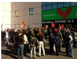
Carrefour, 30 oct.

Malgré les vacances scolaires et le week-end de trois jours, les militants du syndicat FERC-Sup CGT de l'UTM répondent présents samedi, pour un tractage devant l'entrée n°2 du centre commercial Carrefour à Portet sur Garonne.