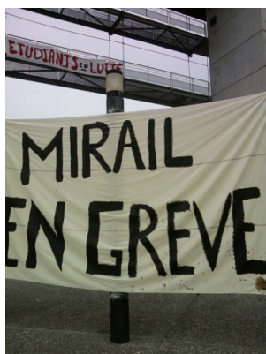
UTM, 5 nov.

Comme avant les vacances, la FERC-Sup CGT invite les agents de l'UTM à se rassembler devant l'université pour protester contre la décision autoritaire de la direction de suspendre les activités et ainsi de vider l'établissement de ses étudiants et personnels.