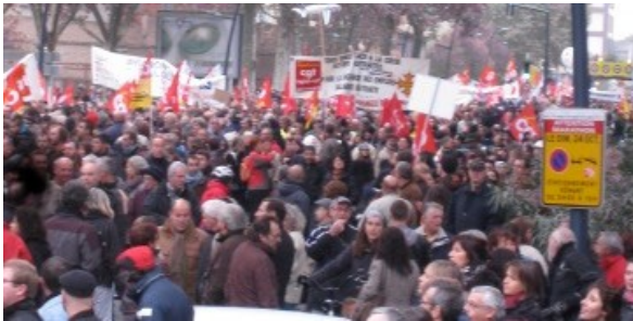
manifestation toulousaine, 19 oct.