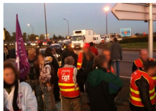
Thalès, 22 oct.