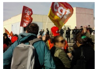
Medef, 29 oct.