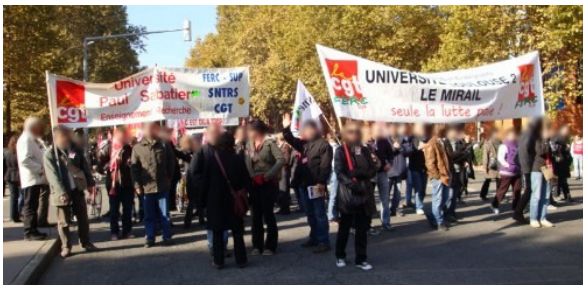
manifestation toulousaine, 21 Oct.